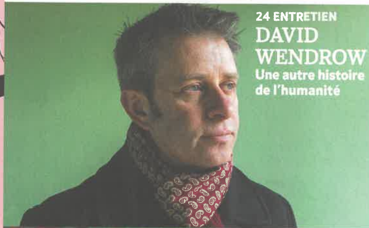
24 ENTRETEN DAVID WENGROW Une autre histoire de l'humanité