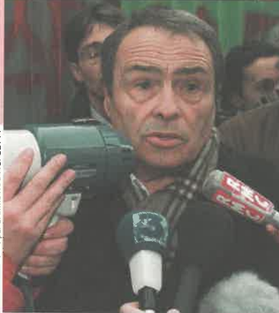
55 RÉFÉRENCE PIERRE BOURDIEU